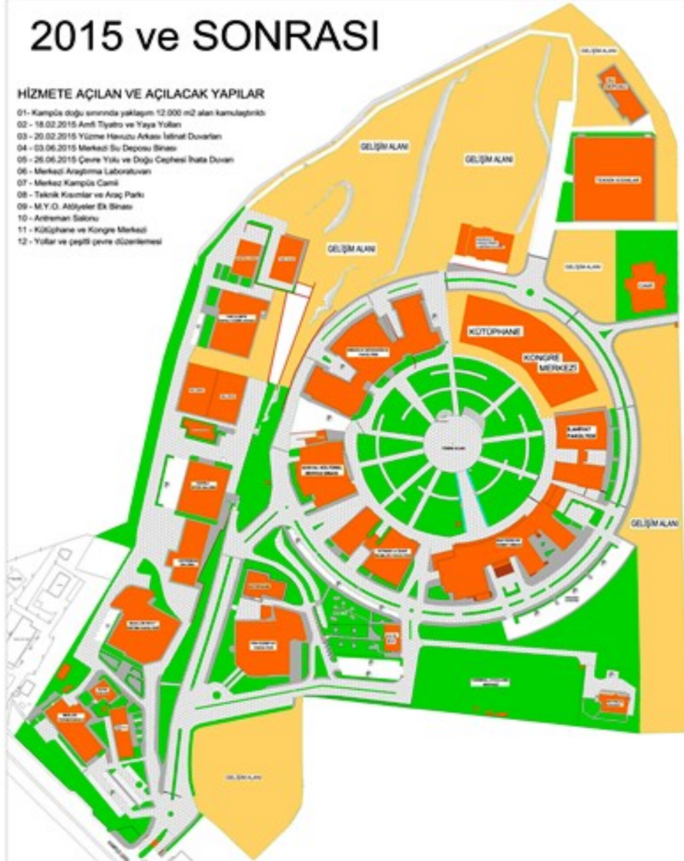
Şekil.1 Kilis 7 Aralık Üniversitesi Yerleşke Planı